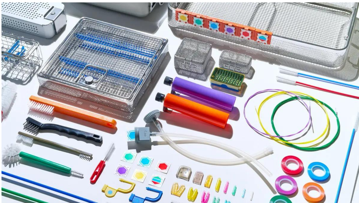
中央材料室（再生処理部門）で使用されるSALWAYの製品群

SALWAYは、医療機関の再生処理部門で使用される製品をセレクトしたブランドです。洗浄・組立・包装・滅菌の一連の再生処理で使用される製品群、具体的には洗浄ブラシやバスケット、コンテナ、滅菌確認デバイスなどを医療機関へ提供しています。ウェブサイトでは再生処理の知識や、業界のオピニオンリーダーへのインタビュー記事などを発信し、中央材料室を支援しています。